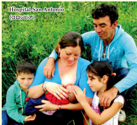
Hospital San Antonio (チェコ)